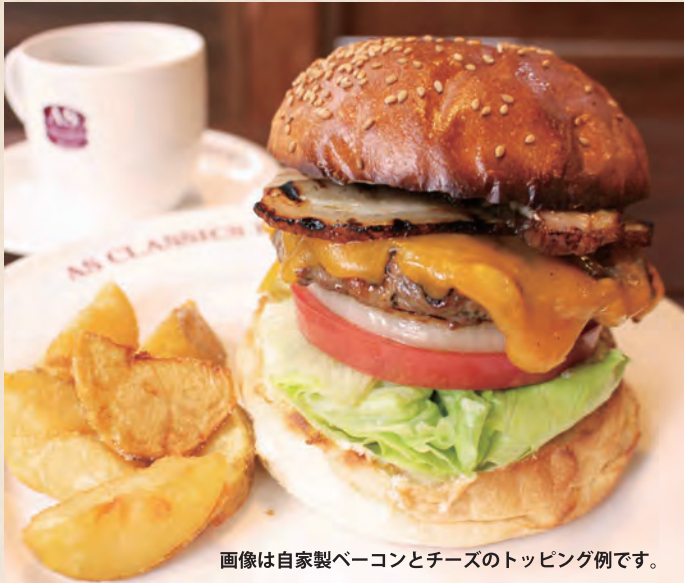
画像は自家製ベーコンとチーズのトッピング例です。